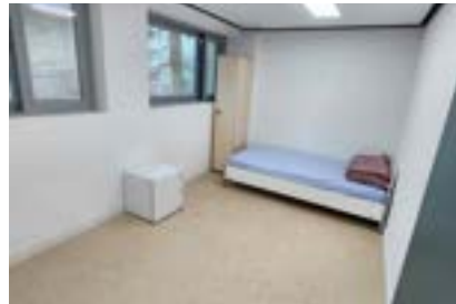
침실 (1인1실, 개인사물함, 냉장고비치)