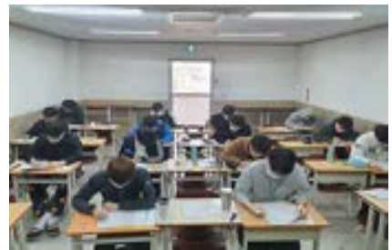
주간 성취도평가 시간