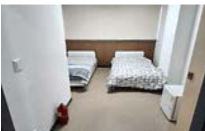
숙소 (2인1실, 개인사물함, 냉장고비치)