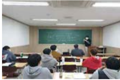
소수 반편성 수업