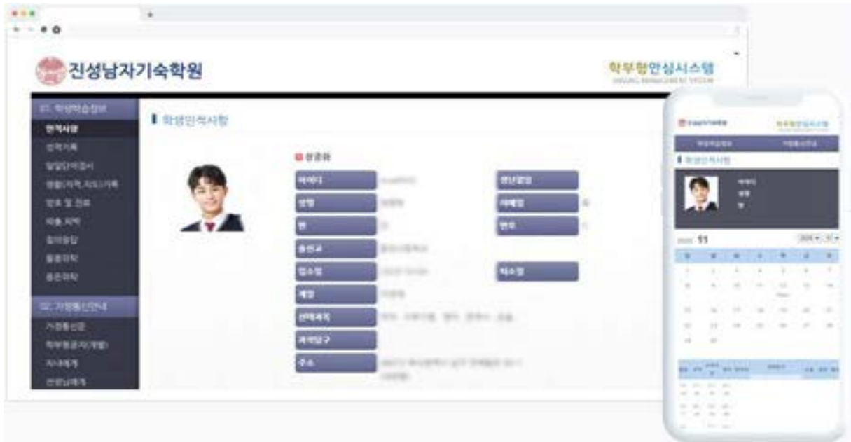
▲ 본원 홈페이지 학부모 안심시스템 로그인 예시 화면 (PC 또는 스마트폰)