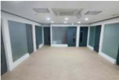
숙소 로비 (1인1실)