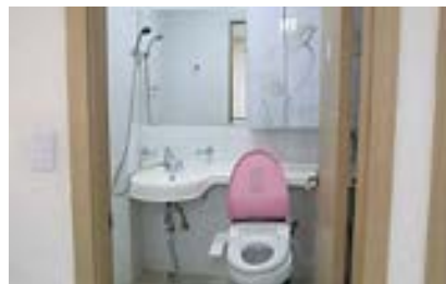
숙소내 욕실 (비데설치)